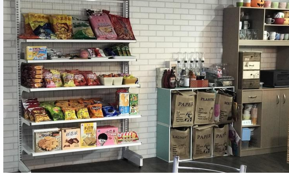
咖啡零食區 免費提供咖啡與零食(永遠充足)