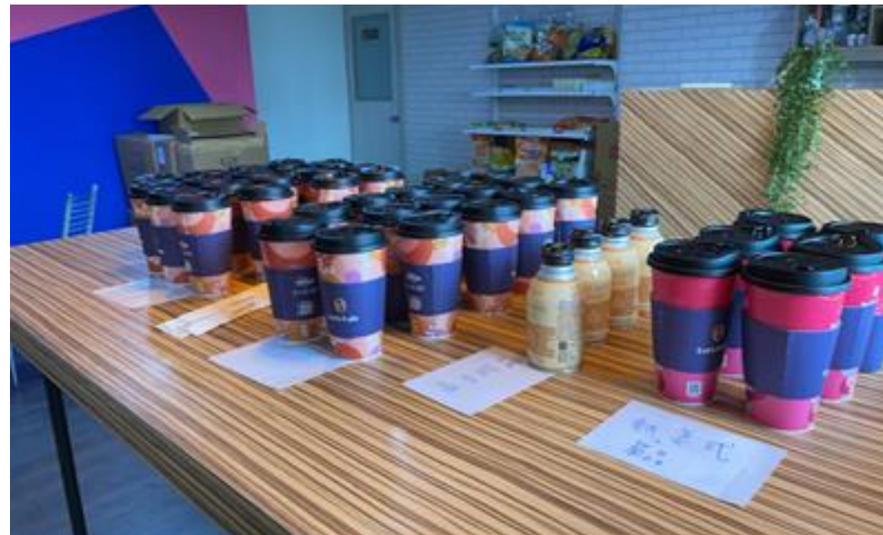
不定時的下午茶時間