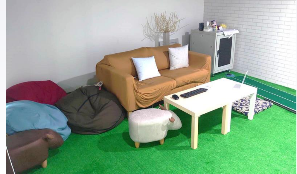
發呆區 愜意休閒的舒適空間