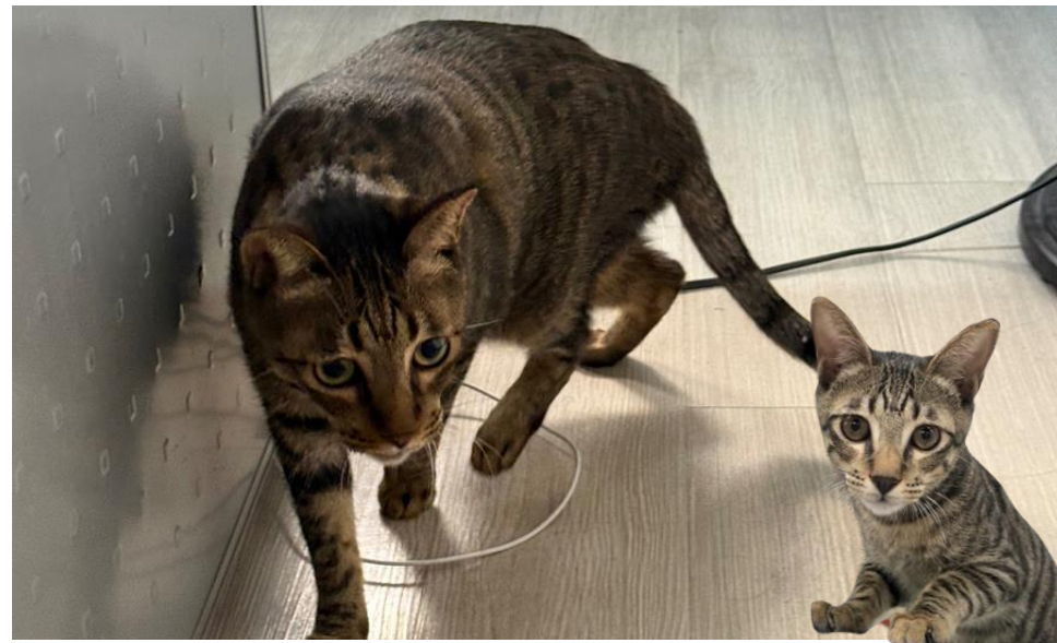
可以帶寵物一起來上班!