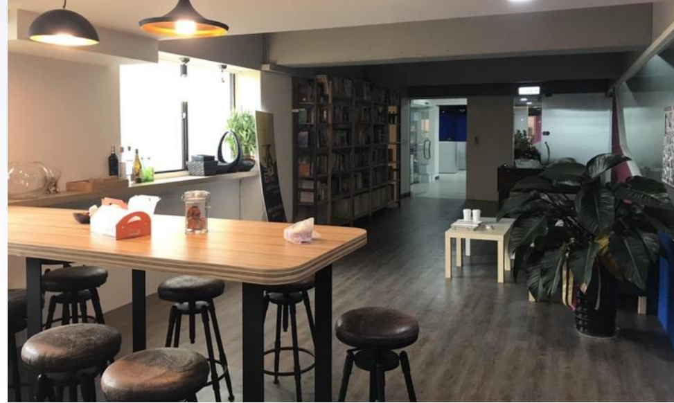
吧台區 休息、充電吃東西的空間